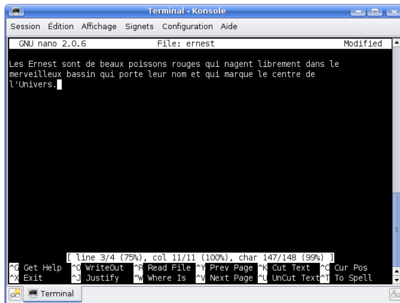
FIGURE 3 – L'éditeur de texte nano

Une fois nano, vous devriez voir une invite avec le nom de la machine.